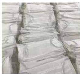
in TNT doppio strato

Sull'e-commerce di Studio Stands è possibile acquistare diverse tipologie di mascherine protettive per ogni necessità: mascherine bavaglio, mascherine FFP2 (KN95), mascherine monouso, mascherine in doppio strato TNT e mascherine personalizzate con grafica pronta oppure con il design del cliente. Tutti i modelli citati sono disponibili con sconti per quantitativi elevati.