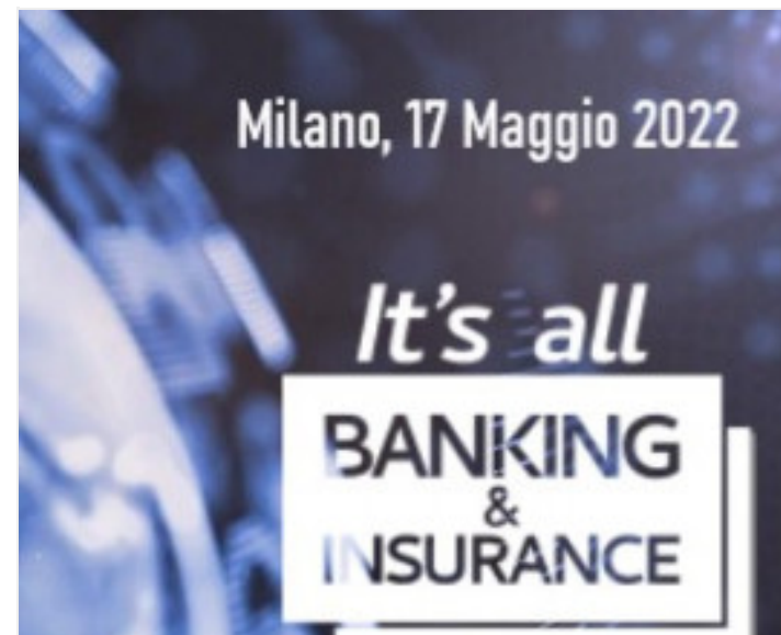
IT'S ALL BANKING&INSURANCE 17 MAG