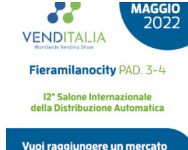
VUOI RAGGIUNGERE UN MERCATO VENDITALIA: 11-14 MAGGIO 2022