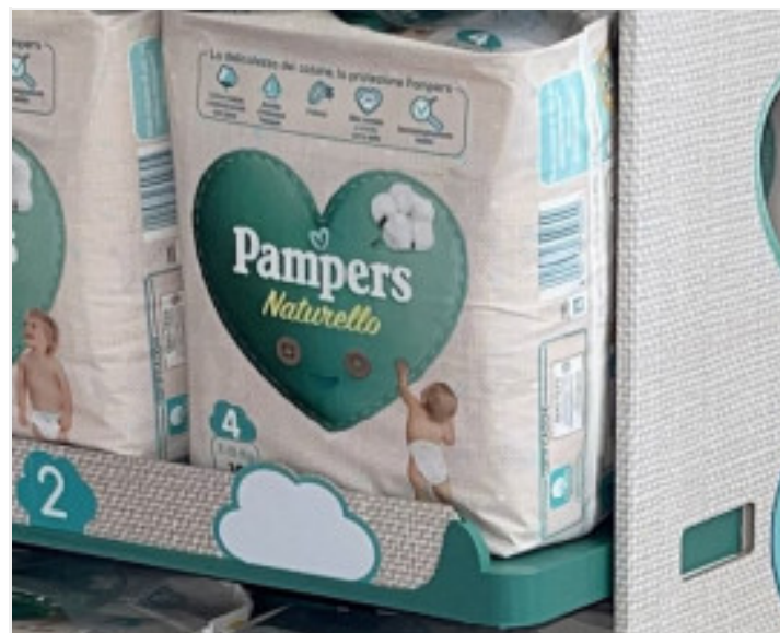
DISPLAY E GIOCATTOLI CLEMENTONI DAI PANNOLINI RICICLATI