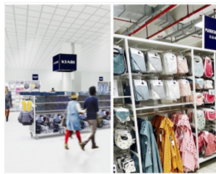
KIABI TRE SHOP IN SHOP IN COOP